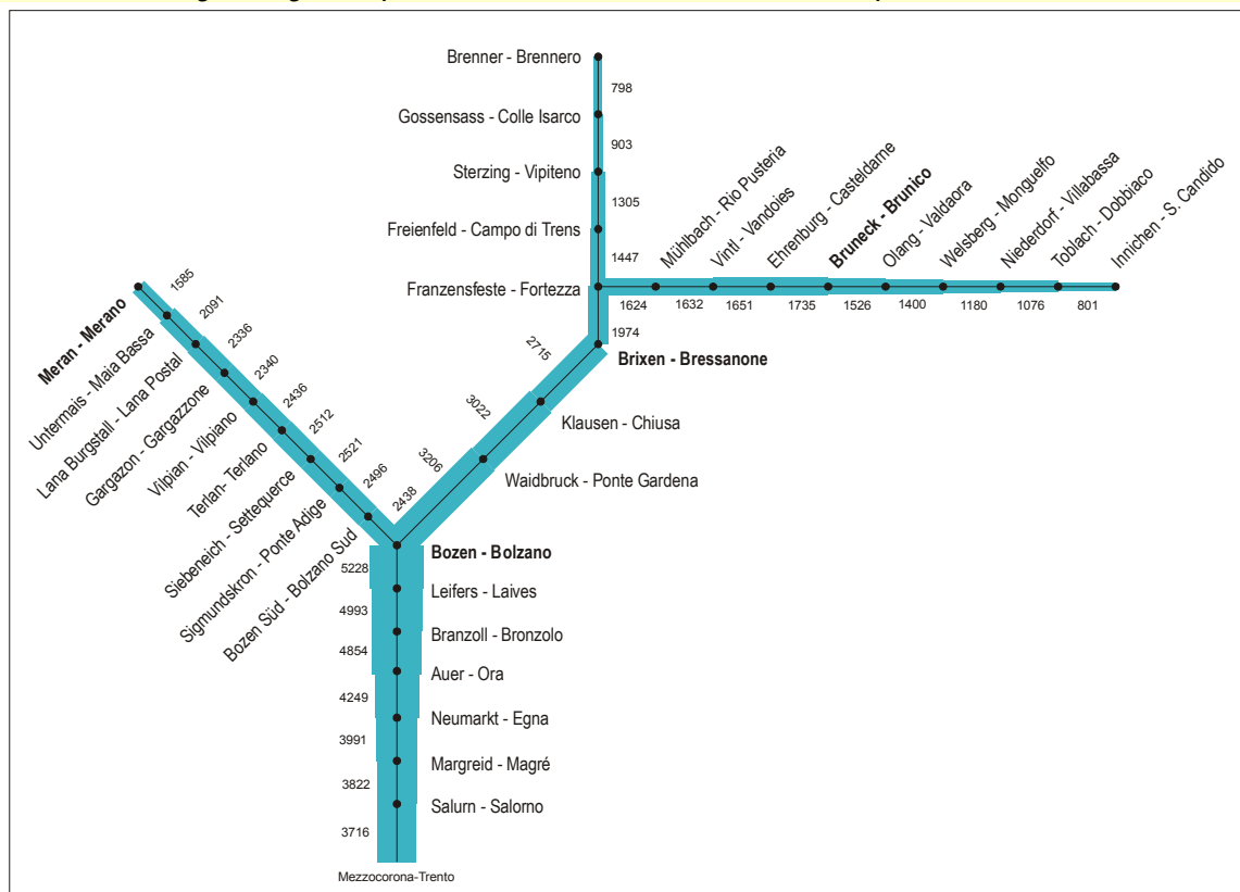
Grafico 2: Treni regionali ed interregionali sulle ferrovie in provincia di Bolzano: passeggeri al giorno per tratto – rilevamento 2004, media ponderata

Brennerlinie: ohne Eurocity-, Euronight-, Express-, Intercity und Eurostar-Italia-Züge. Fahrgäste pro Abschnitt: Summe beider Fahrtrichtungen. Auf den einzelnen Abschnitten werden auch die Fahrgäste von Zügen gezählt, die in den betreffenden Bahnhöfen nicht halten (z. B. enthält der Abschnitt Branzoll-Leifers auch die Fahrgäste der Interregionalzüge, die weder in Leifers noch in Branzoll halten). Gewichtung: Juli 30%, Januar 70%